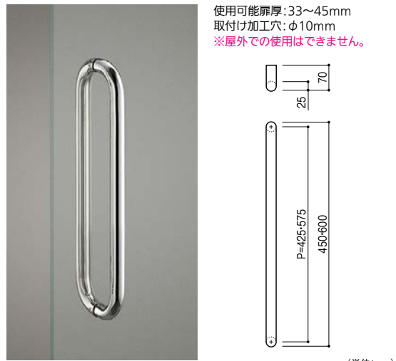
ステンレスミラー

使用可能扉厚:33~45mm 取付け加工穴:φ10mm ※屋外での使用はできません。